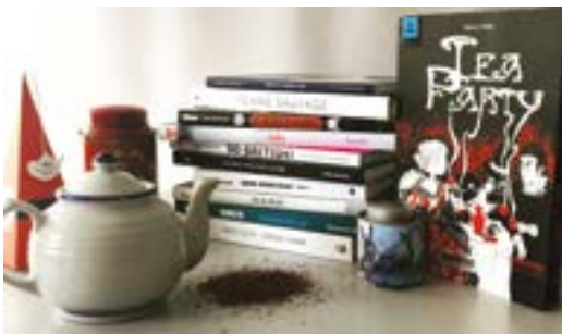
BM de Tours