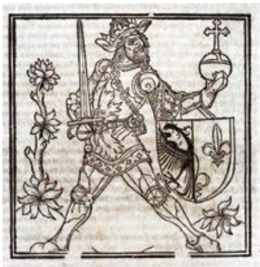
DR BM Tours