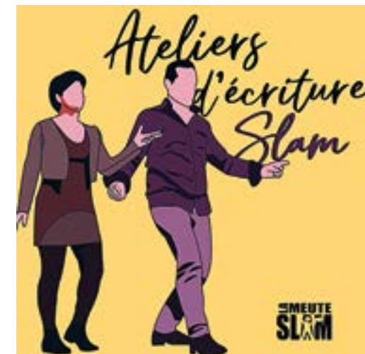
DR BM Tours