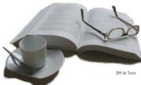
BM de Tours

Les bibliothécaires vous invitent à leur café littéraire : venez échanger avec eux et parler de vos lectures, de celles que vous aimez, de celles que vous voulez conseiller. Ou venez simplement chercher des idées... samedi 29 janvier, samedi 26 mars – 16h30 ⌚ 1h30 Bibliothèque de la Bergeonnerie