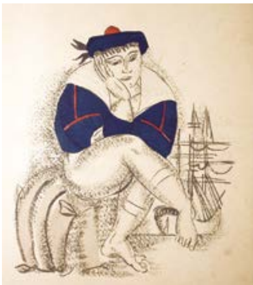
DR BM Tours

Sur inscription – Nombre de places limité en raison du caractère précieux des documents.