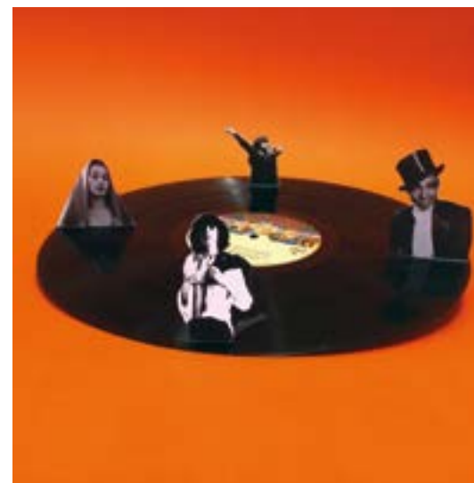
DR BM Tours