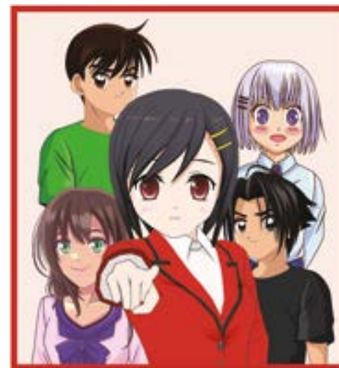
DR BM Tours