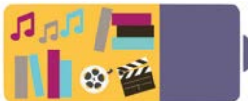
BM de Tours

Une fois par mois à l'espace Escale à partir de 17h et recharge ta pile. Cf p 7 mercredi 12 janvier, mercredi 9 février, mercredi 16 mars – 17h ⌚ 1h Bibliothèque Centrale