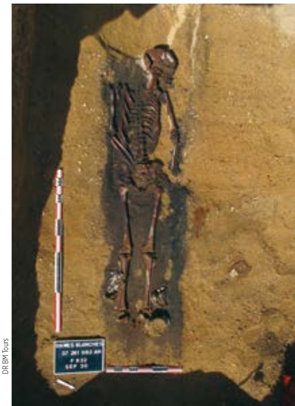
DR BM Tours